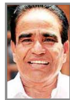
കമ്മിറ്റി എന്നിവയിൽ അംഗമായിരുന്നു.