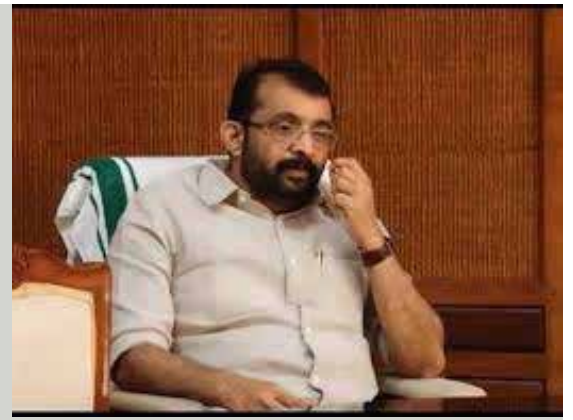
പി.ശ്രീരാമകൃഷ്ണൻ സ്പീക്കർ, കേരള നിയമസഭ

“ ഇന്ത്യൻ പൗരനായ ഞാൻ ആരാണ് എന്നറിയാൻ ഭരണഘടന അറിയണം. ഇന്ത്യയെന്താണെന്നറിയാൻ ഭരണഘടന അറിയണം. അതുകൊണ്ട് ഭരണഘടനാപഠനം തന്നെ ഒരുതരത്തിൽ സ്വയംപഠനമാണ്. തന്നെക്കുറിച്ചു തന്നെയുള്ള പഠനം