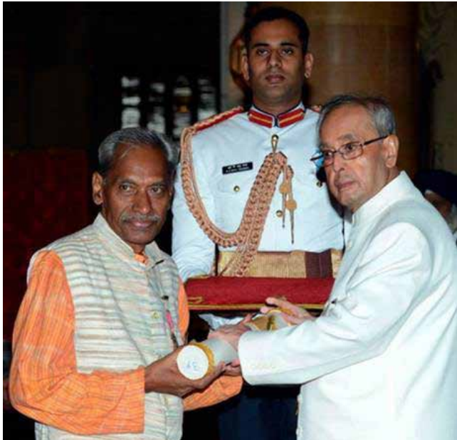
സുഭാഷ് പലേക്കർ രാഷ്ട്രപതിയിൽ നിന്നും അവാർഡ് സ്വീകരിക്കുന്നു

അതു സത്യമാണ്. സൗണ്ട് തെറാപ്പി കൊടുത്താൽ ചെടികൾക്ക് നല്ല മാറ്റമുണ്ടാകുന്നുണ്ട്. ചെറിയ ശബ്ദത്തിൽ പാട്ടുവച്ചുകൊടുത്താൽ മരങ്ങളുടെ ഏകാന്ത മാറിയിട്ടുണ്ടെന്നും കായ്ഫലം വർദ്ധിക്കുന്നതും എന്റെ അനുഭവമാണ്.