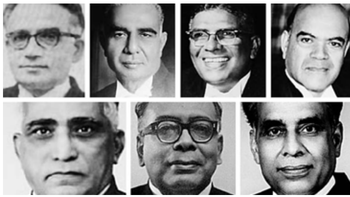
കേശവാനന്ദഭാരതി കേസിലെ ഭൂരിപക്ഷബെഞ്ച്

അപ്പർവ്വതകളുടെ, അസാധാരണ ത്വത്തിന്റെ, അനിശ്ചിതത്വങ്ങളുടെ വിന്യായമായിരുന്നു ഈ കേസ്. മലബാറിലെ മറാഠിപതിയായിരുന്ന കേശവാനന്ദഭാരതിക്ക് ഭൂപരിഷ്കരണ നിയമംമൂലം സ്വത്തുവകകൾ നഷ്ടപ്പെടുകയുണ്ടായി. 1963 ലെ കേരള ഭൂപരിഷ്കരണ നിയമം, 1969 ലെ കേരള ഭൂപരിഷ്കരണ (ഭേദഗതി) നിയമം എന്നിവ റദ്ദാക്കണമെന്നാവശ്യപ്പെട്ട് 1970 ൽ കേശവാനന്ദഭാരതി സുപ്രീംകോടതിയെ സമീപിച്ചു. രാജ്യത്തിന്റെ ഭരണഘടനയുടെ ഭാവി നിശ്ചയിച്ചത് 1970 ലെ ഈ 135-ാം നമ്പർ റിട്ട് പെറ്റീഷനാണ്. ഇതേ വിഷയം സംബന്ധിച്ച് ഗോലക്നാഥ് കേസിൽ 11 അംഗ ബെഞ്ചാണ് വിധി പറഞ്ഞത്. അതുകൊണ്ട് കൂടുതൽ വിശാലമായ 13 അംഗ ബെഞ്ചാണ് കേശവാനന്ദഭാരതി കേസ് കേട്ടത്.