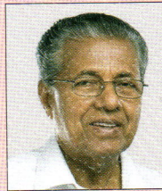
ശ്രീ. പിണറായി വിജയൻ ബഹു. കേരള മുഖ്യമന്ത്രി