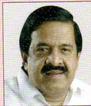
ശ്രീ. രമേശ് ചെന്നിത്തല ബഹു. പ്രതിപക്ഷ നേതാവ്