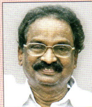
ശ്രീ. എ. കെ. ബാലൻ ബഹു. പട്ടികജാതി പട്ടികവർഗ്ഗ പിന്നോക്ക സമുദായക്ഷേമവും നിയമവും സാംസ്കാരികവും പാർലമെന്ററികാര്യവും വകുപ്പുമന്ത്രി