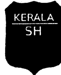
Table 5.1 Right of way guideline for State highway

State Highways are arterial roads connecting district headquarters and important towns within the state and connecting national highways or highways of the neighbouring state.