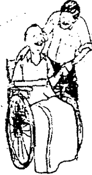
ഈ അവസ്ഥയാണ്. പ്രതിരോധശേഷി നന്നേ കുറവായ വൃക്ക

ഒരു വർഷമായി മരുന്നില്ലാത്തതും സർക്കാർ നിർമ്മാണപ്രവൃത്തി എന്താൽ ജില്ലാ പഞ്ചായത്തിന്റെയും മറ്റും ഇടപെടൽ മൂലം വീണ്ടും തുടങ്ങാൻ കഴിഞ്ഞു. താഴ്ന്ന തീരുമാനമായി. തിരുവനന്തപുരം, പെരിന്തൽമണ്ണ എന്നിവിടങ്ങളിലെ ജില്ലാ ആശുപത്രികൾ വഴി രാവിലെ 10 മുതൽ ഉച്ച വരെയാണ് വിതരണം. ഈ സമയത്തല്ലാം വൃക്കരോഗികൾ മറ്റു രോഗികൾക്കൊപ്പം വരിനിൽക്ക